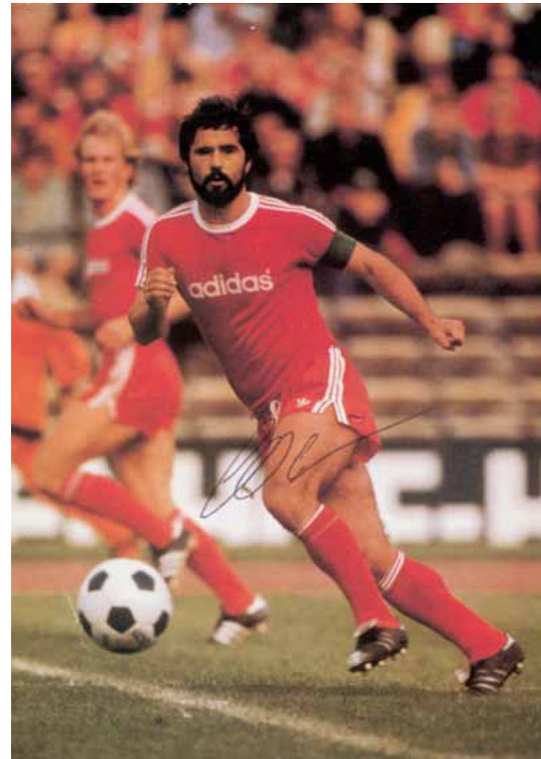
Gerd Müller (*1945) Bundesligaaufsteiger mit dem FC Bayern München 1965 DFB-Pokalsieger '66, '67, '69, '71 Europapokalsieger der Pokalsieger 1967 Deutscher Meister '69, '72, #73, '74 Europapokalsieger der Landesmeister 1974, 1975, 1976 Welpokalsieger 1976

Der Beitrag, den Gerd Müller zum Aufstieg des FC Bayern zu einer europäischen Topadresse leistete, ist unermesslich: 365 Tore erzielte der „Bomber der Nation“ in 427 Bundesligaspielen. Eine unglaubliche Marke! Müller war ein Phänomen, es gab nie mehr einen vergleichbaren Spieler.